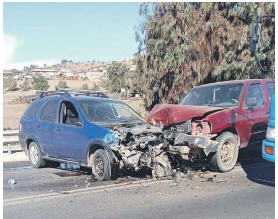
Foto de un accidente del archivo de El Ovallino.

Aprovechando el incremento de desplazamientos durante estas fechas de temporada festival y el constante flujo de vehículos por las diferentes rutas de la región, el Capitán