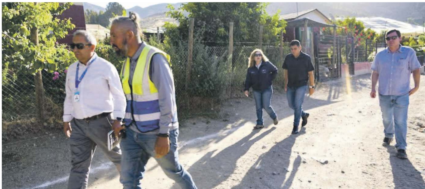
Las autoridades y pobladores destacaron el inicio de la obra en las calles proyectadas 1 y 2, junto al tramo respectivo a Mialqui.

“Cuando recién llegábamos, aportamos una cantidad importante de nuestro presupuesto para la ejecución de este proyecto. Después tuvimos que hacer un aporte extra y se licitó varias veces y no tenía oferente. Y hoy gracias a que pudimos hablar con el ministro de Vivienda y Urbanismo, Carlos Montes, se asignaron recursos extras que permitirán ejecutar esta obra. Así que contentos porque es otra obra más que se está materializando en nuestra comuna, de varias que se están ejecutando; ya no es un anuncio. Por fin ya la empresa está en el lugar y comenzó con los trabajos de pavimentación”, indicó el alcalde