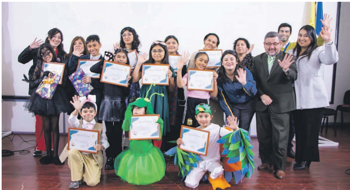
CON ÉXITO CULMINA CONCURSO DE CUENTERÍA EN CAPITAL PROVINCIAL