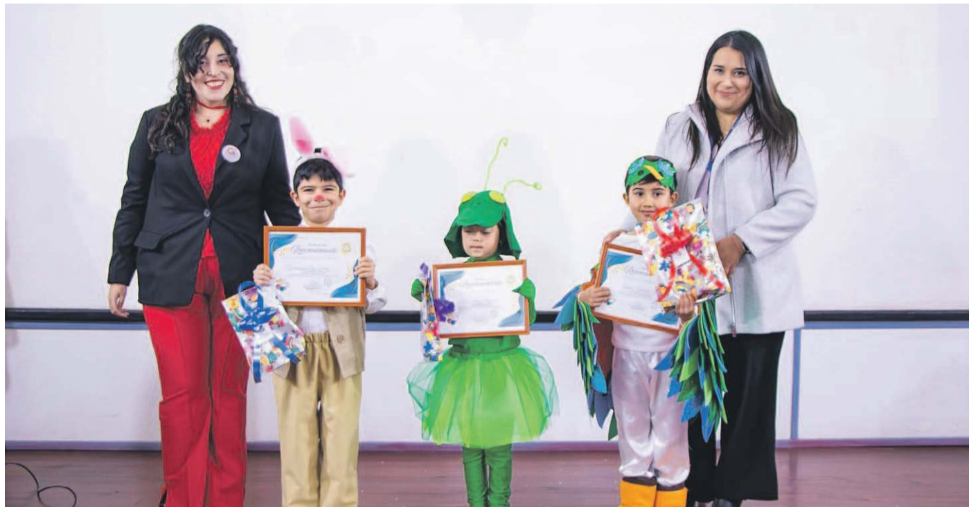
El certamen incluyó categorías entre la educación parvularia y la enseñanza media.