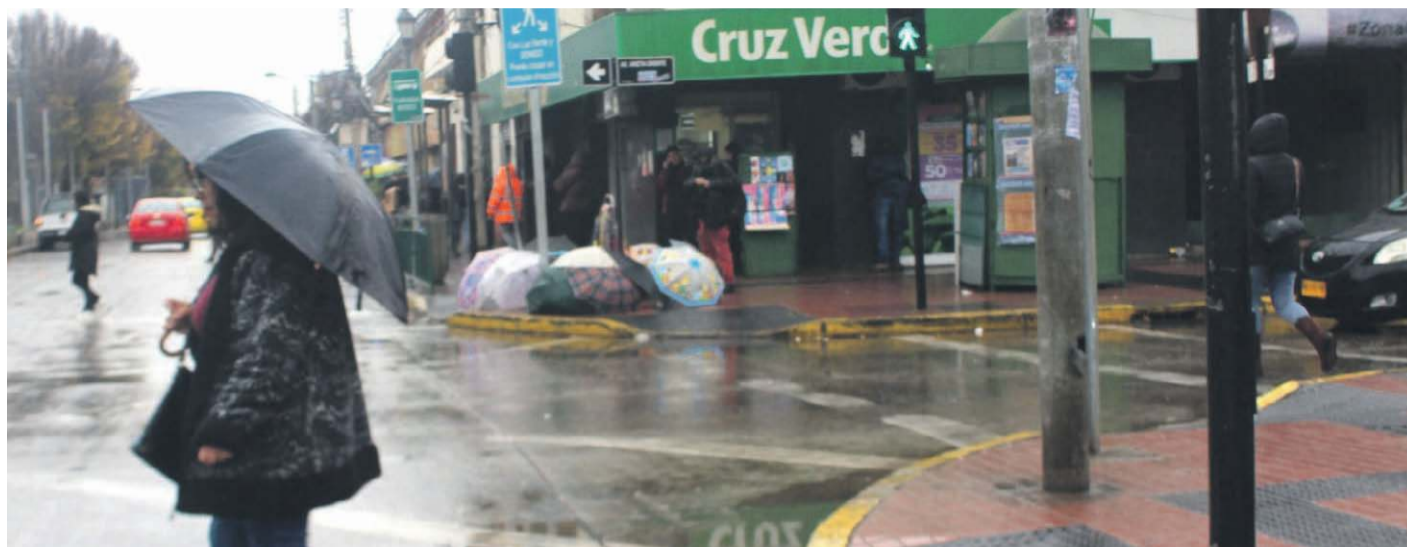
La lluvia se haría presente nuevamente en buena parte de la región.