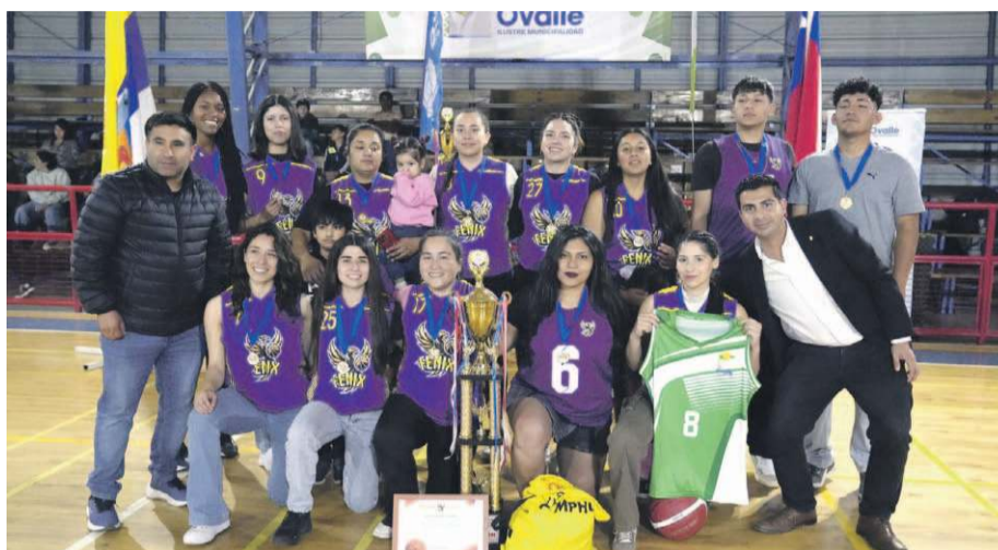
El evento contó con la participación de cuatro elencos de mujeres y ocho cuadros masculinos, quienes se enfrentaron en entretenidos encuentros.

En la final femenina, el Club Deportivo Fénix se coronó campeón tras superar a Cancha Rayada, que quedó en el segundo lugar. En tanto, en la rama masculina, Cancha Rayada obtuvo el título luego de vencer a El Molino en un partido de alta exigencia, donde quedó demostrado el buen juego de los basquetbolistas locales, quienes disputaron un partido que hizo vibrar al público local. En tanto, el tercer