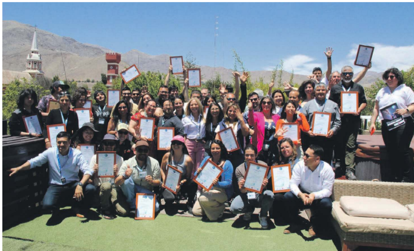
La especialización permitirá a estos guías diferenciarse de sus pares existentes quienes, al día de hoy, mantienen la clasificación de guía general.

La Fundación Starlight es una entidad creada en el año 2009, para la difusión de la astronomía y la promoción, coordinación y gestión del "movimiento