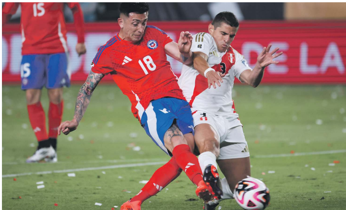
Chile estaba obligado a conseguir un triunfo ante Perú en Lima, pero no hizo mucho para lograrlo.

Un triste y pobre empate en blanco que no le sirve de nada, cosechó anoche el seleccionado de fútbol de Chile ante Perú, en el Estadio Monumental de Lima. El próximo martes la Roja recibe a Venezuela.