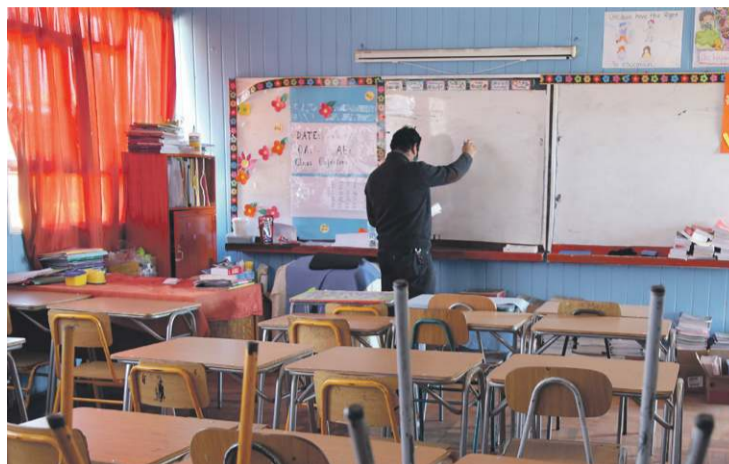
Desde la seremi de Educación afirman que la suspensión del SAE no afecta ni pone en riesgo el proceso de Admisión Escolar 2025.